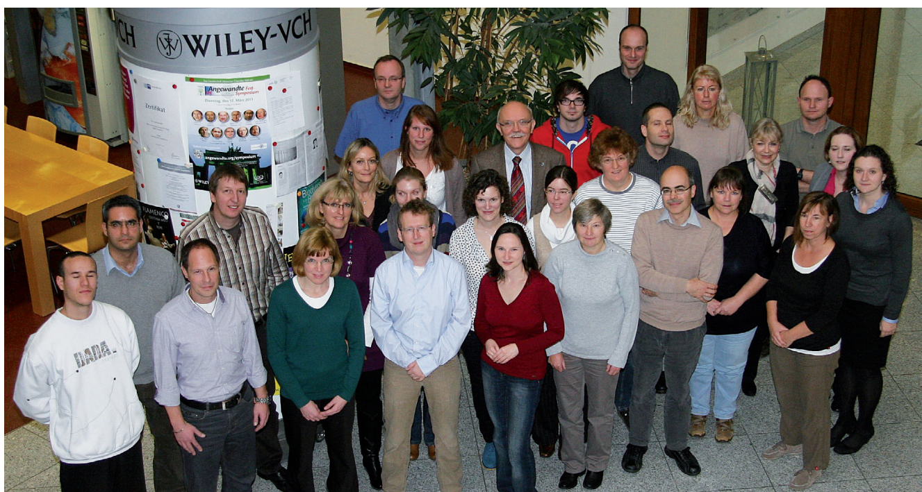
Abbildung 3. Ein großer Teil der Redaktions- und Herstellungsmitarbeiter/innen (siehe auch Impressum).

tronische Eingangskorb schon wieder voll; und wenn ein Heft publiziert ist, arbeitet die Redaktion schon wieder an den nächsten drei, vier oder fünf Heften. Der Lohn für die Sisyphosarbeit ist aber hoch: Jedes neue Manuskript, das die Redaktion erreicht, ist ein Zeichen des Vertrauens der Autoren in unsere Arbeit, und es bietet den Reiz des ersten Blicks in völlig neue Erkenntnisse.